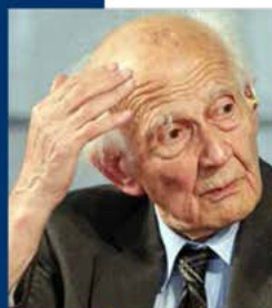
A fianco Zygmunt Bauman; sotto, serata del festival in piazza Grande

Comuni di Modena, Carpi e Sassuolo, la Provincia di Modena, la Fondazione Collegio San Carlo, la Fondazione Cassa di Risparmio di Carpi e la Fondazione Cassa di Risparmio di Modena.